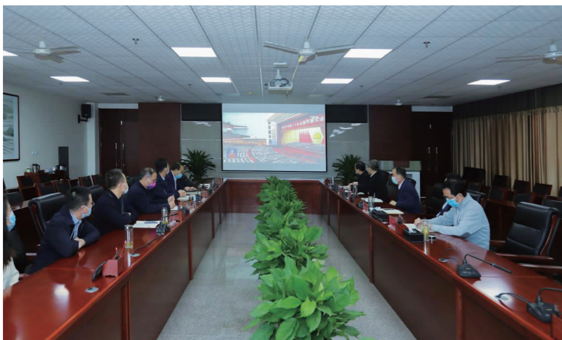
我校师生收听收看党的二十大开幕会盛况