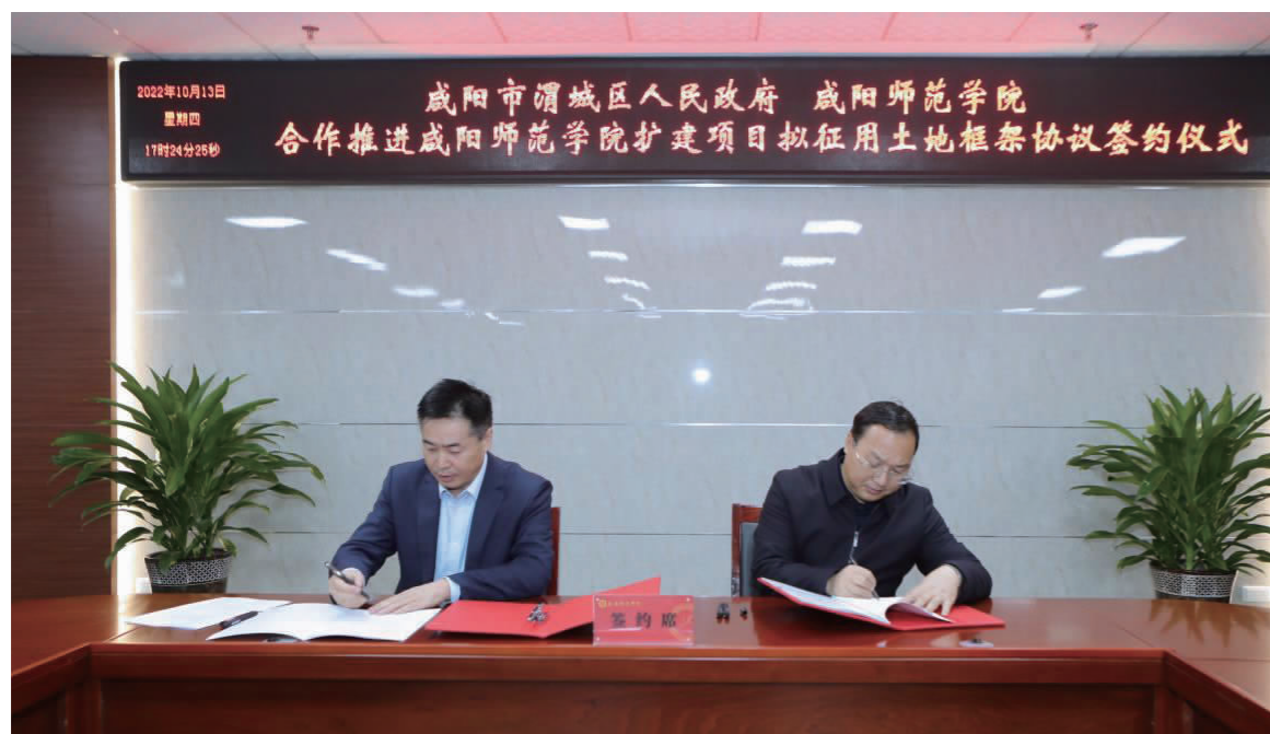
我校与渭城区人民政府签订合作共建框架协议