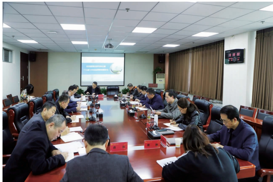
我校党委理论学习中心组专题学习十九届七中全会精神