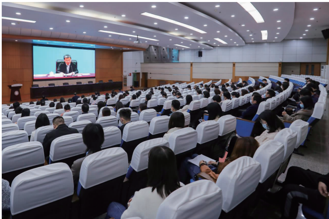
校党委理论学习中心组集中学习党的二十大精神