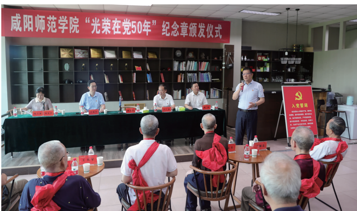
我校举行“光荣在党50年”纪念章颁发仪式