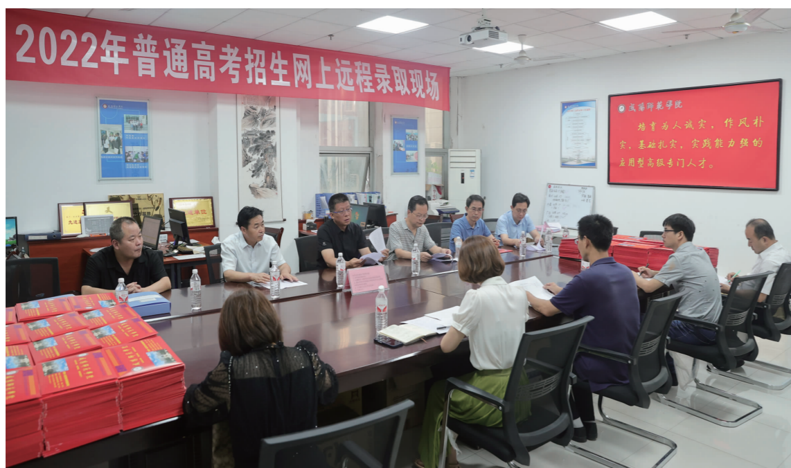
校领导慰问暑期坚守一线教职员工作