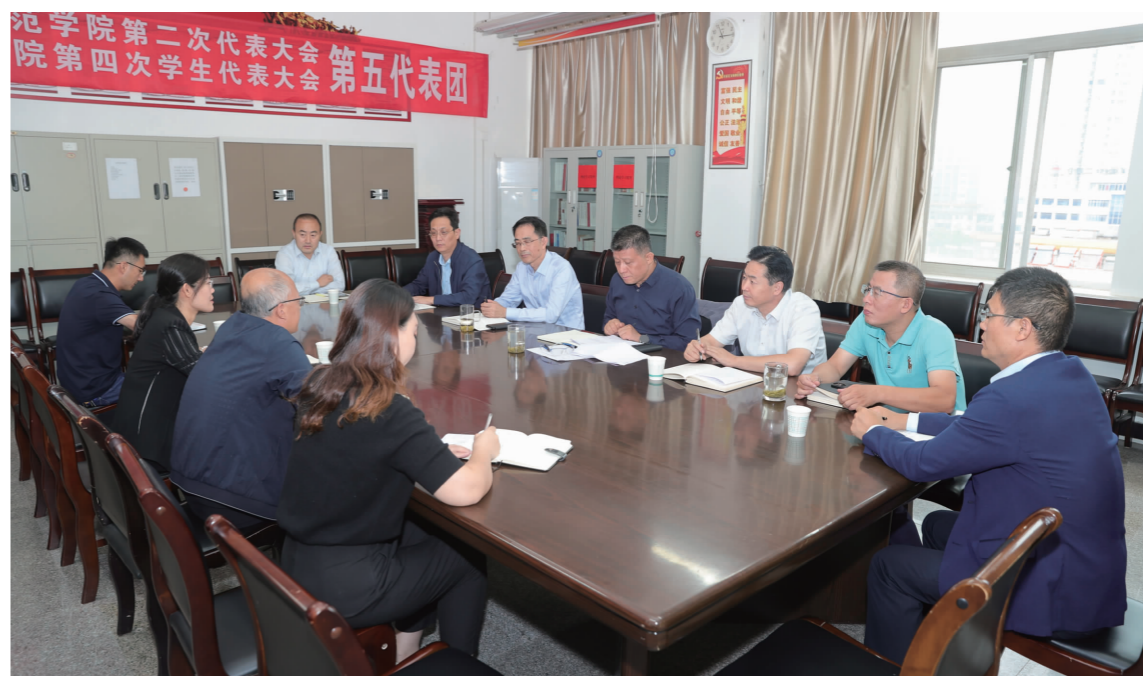
我校召开第二批干部挂职工作总结暨第三批挂职干部座谈会