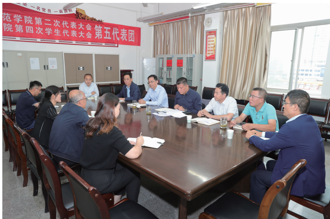
学校领导检查开学准备工作