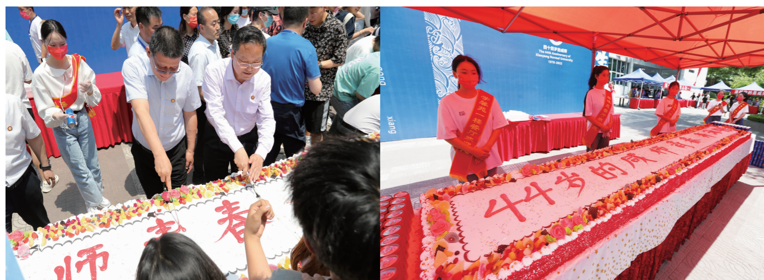
“师生同庆 美好共享”美食主题活动