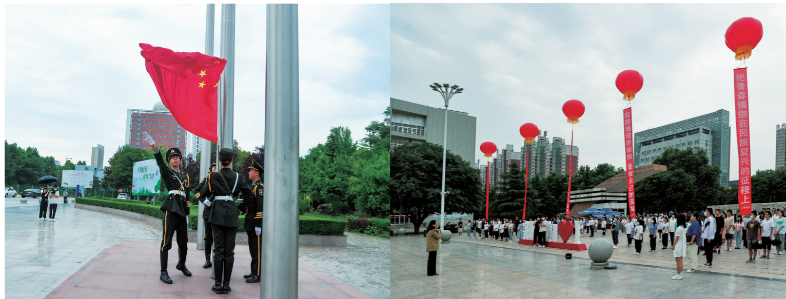
校庆日升国旗仪式