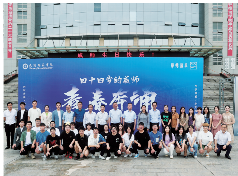
“我与学校同庆”主题活动