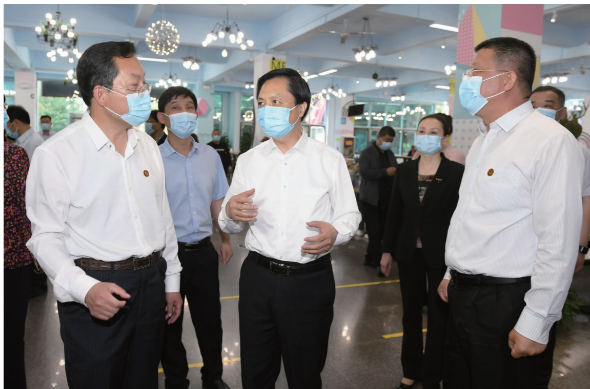
咸阳市委书记夏晓中来我校调研