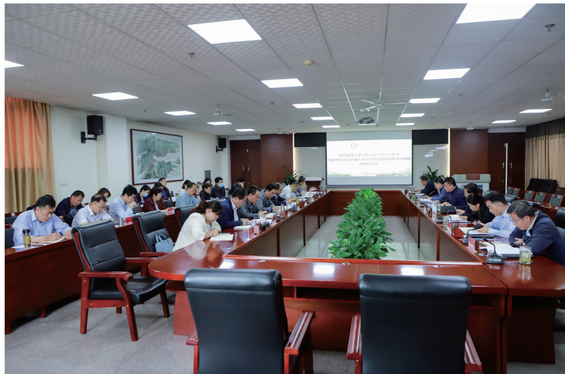
校党委理论学习中心组专题学习习近平总书记在中国人民大学考察时的重要讲话精神