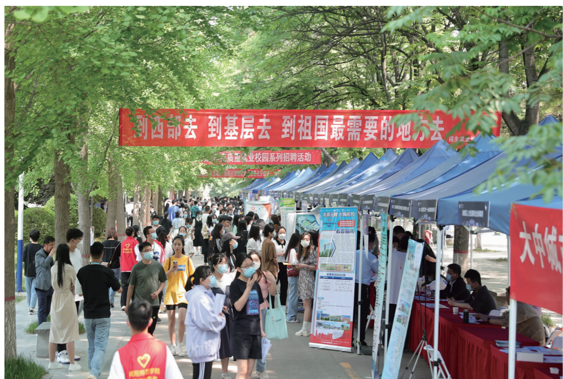
我校成功举办2022届毕业生“访企拓岗促就业”综合类校园招聘会