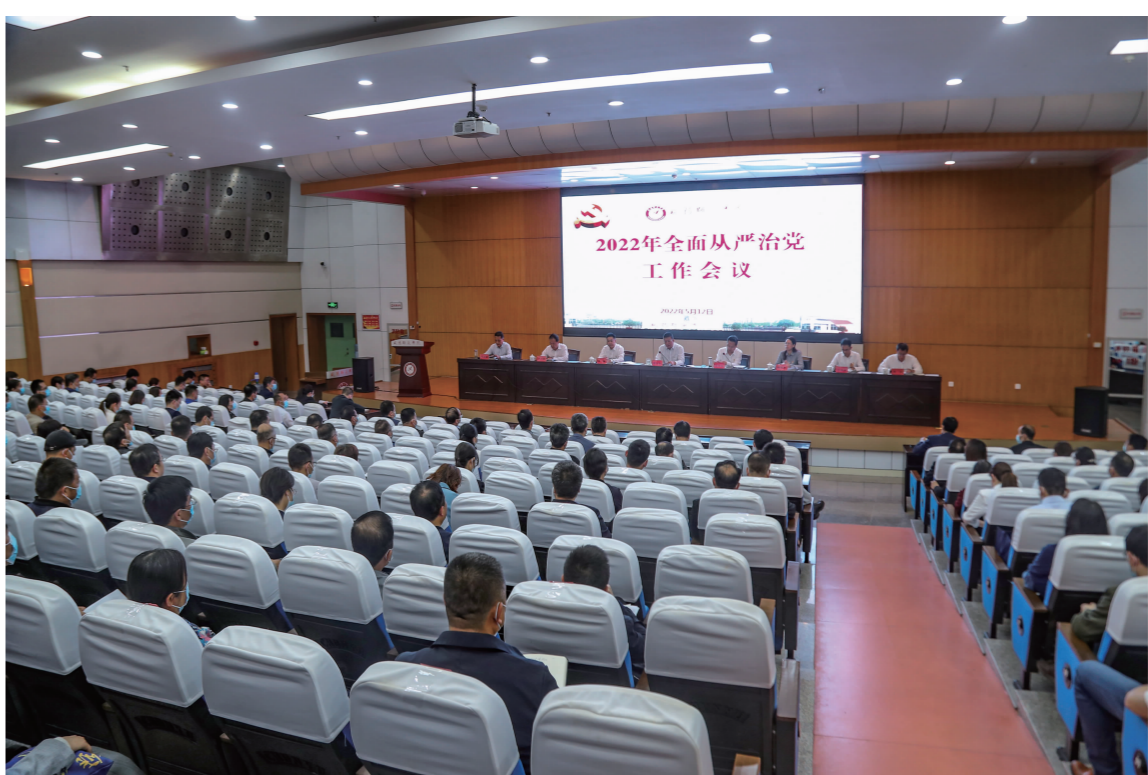
我校召开2022年全面从严治党工作会议