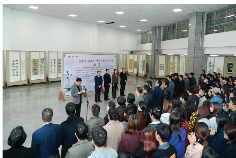
我校举办廉政书画展