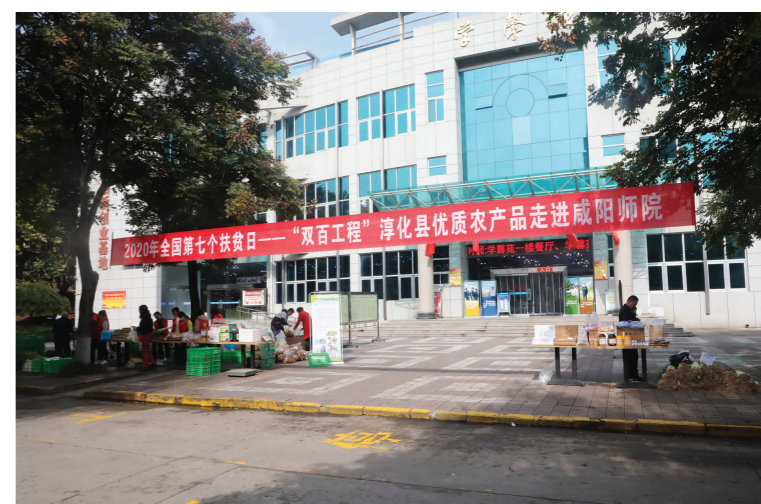
我校举办扶贫日优质农产品进校园活动