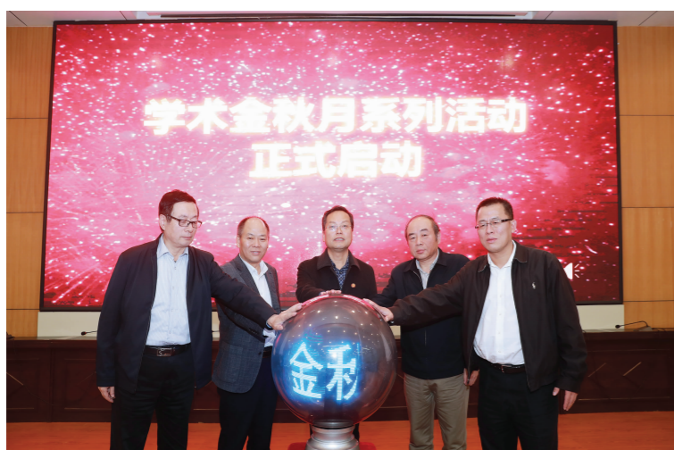
我校2020年学术金秋月活动启动