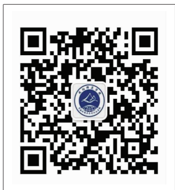
资源环境与历史文化学院