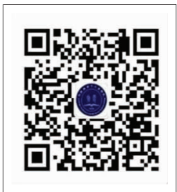
物理与电子工程学院