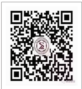
数学与信息科学学院