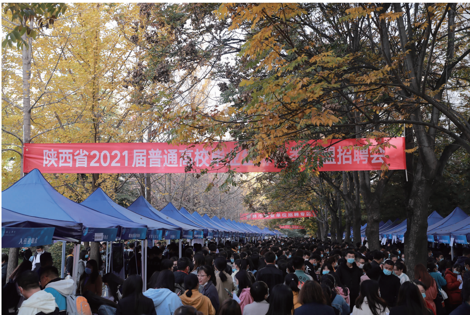
我校成功举办陕西省2021届普通高校毕业生师范类联盟招聘会