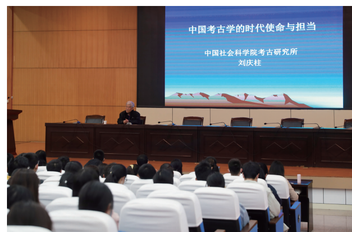
社科名家工作室首席科学家刘庆柱教授来校作报告