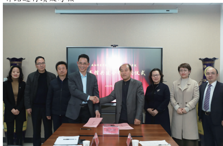
我校与陕西工业职业技术学院签署图书馆共建合作协议