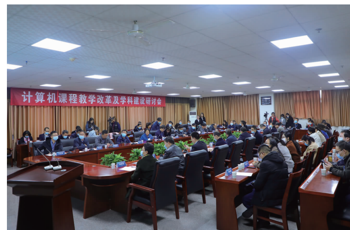
我校召开计算机课程教学改革及学科建设研讨会暨陕西地方高校计算机联盟成立大会