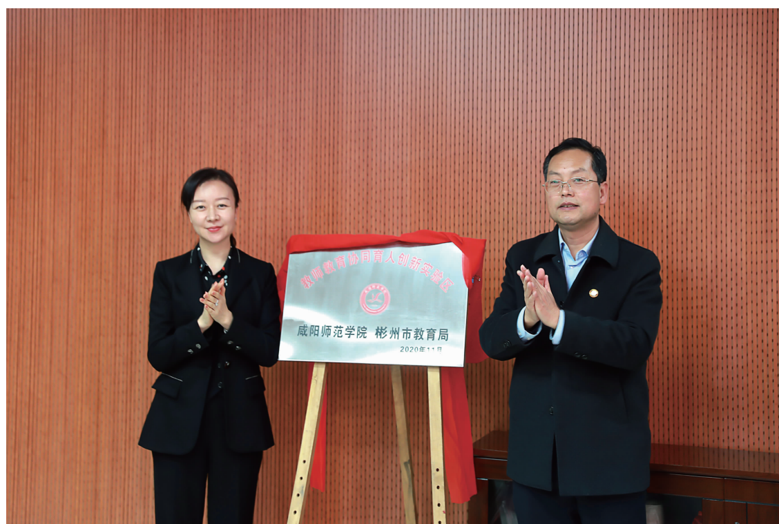
我校与彬州市教育局签署战略合作协议