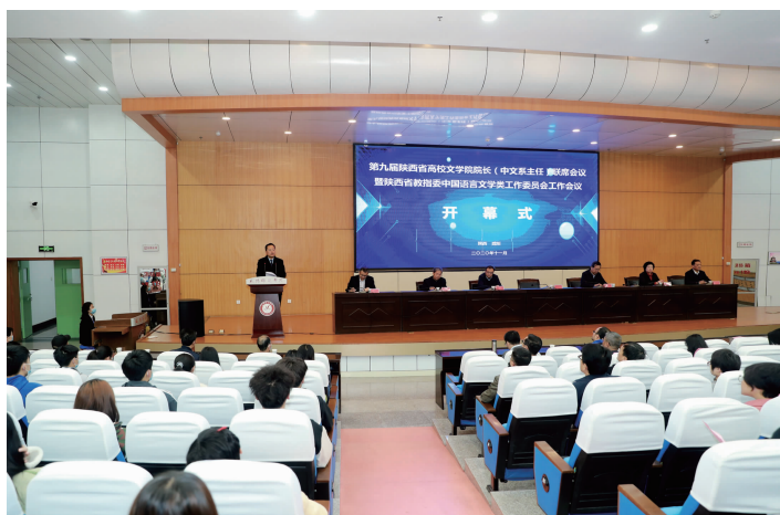
第九届陕西省高校文学院院长联席会议在我校举行