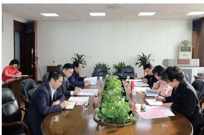
省审计厅检查组来我校检查指导审计工作