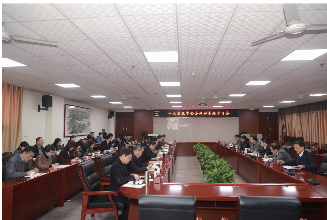
校党委理论学习中心组(扩大)专题学习党的十九届五中全会精神