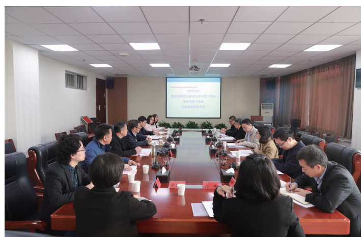
陕西省教育厅专家组对我校研究生联合培养示范工作站进行绩效考核